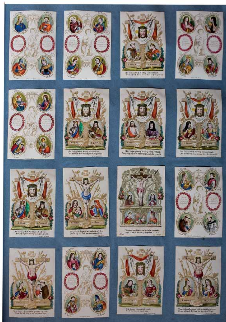
Album d'immagini sacre. Prima metà dell'Ottocento. Presenta un'ampia esemplificazione della produzione Vallardi e Tenenti di Milano e degli stampatori di Praga. Appartenuto ad una famiglia valesiana, è probabilmente un campionario di negozio o di un venditore d'immaginette. Nella pagina vi sono molte immagini con il velo della Veronica e gli strumenti della Passione